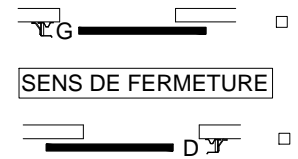
SENS DE FERMETURE